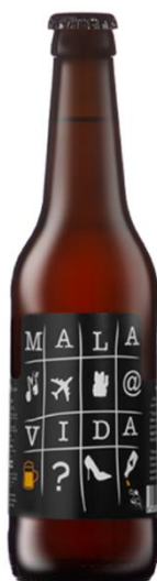
Figura 6. Cerveza Mala Vida.

Y es justo la música, a través de los festivales un tipo de eventos que encaja a la perfección con el neolocalismo y esto se refleja en muchas de las marcas analizadas. Mala Vida sin ir más lejos suele participar como patrocinador en el Mad Cool (Madrid) o en el Iberia Festival (Benidorm).