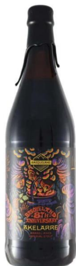
Figura 2. Empaque de Akelarre de Basqueland Brewing Project. (Fuente: tiendaelrestrogusto.es 2020).

En la figura 3 vemos cómo la lata de Lau Teilatu muestra un gran caserío vasco en tonos oscuros: