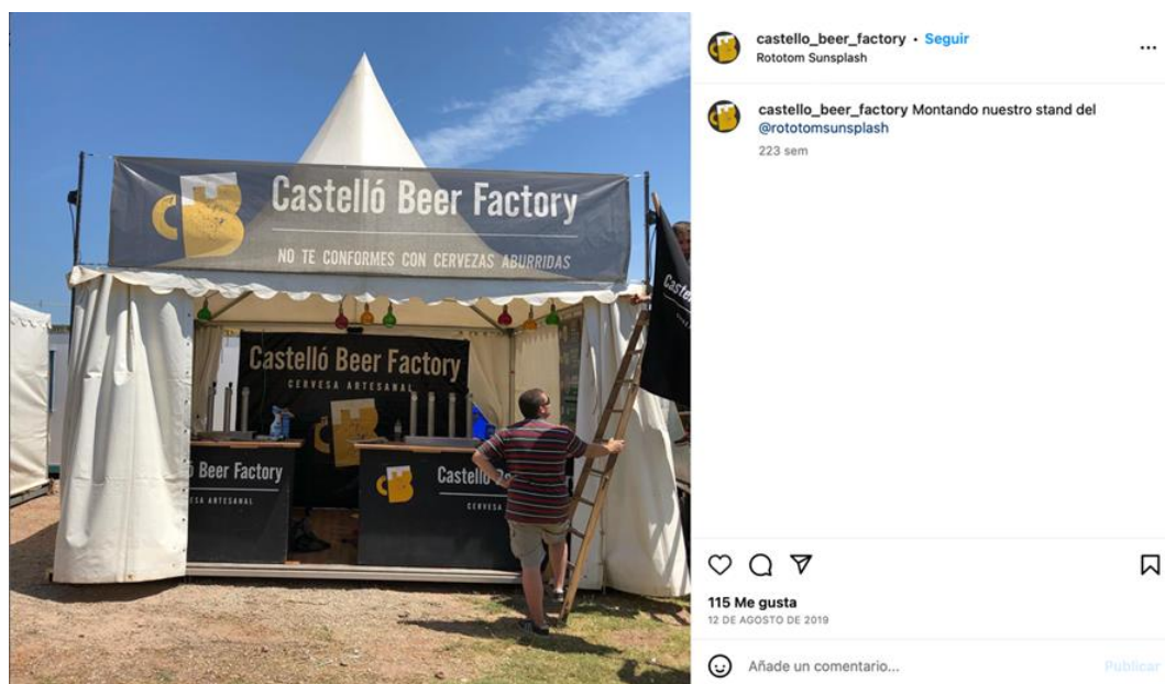
Figura 5. Presencia de Castelló Beer en la feria de cervezas Castelló.

Otra Comunidad Autónoma que cuenta con una lengua propia es la Comunidad Valenciana y allí, al estilo de la Oktoberfest de Múnich, participa periódicamente las ferias de locales de cervezas artesanas, Castelló Beer. Dichos eventos suelen realizarse durante los fines de semana y suponen una de las mejores oportunidades que tienen las productoras de estas marcas de darse a conocer en un contacto directo con sus potenciales clientes: “público de entre 30 a 45 años”, que es el más inclinado a probar nuevos sabores. En la figura 5 se puede ver un ejemplo de Castelló Beer, que cuenta entre sus principales acciones a nivel territorial la participación de su marca en “Castelló ruta del sabor”, una iniciativa del ayuntamiento de Castellón para fomentar la cultura gastronómica local. En este caso, el nombre de la cerveza coincide plenamente con el nombre de la ciudad que la vio nacer en el idioma propio del territorio, el valenciano.