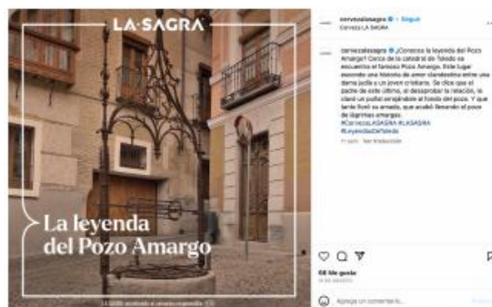
Figura 7. Post de La Sagra. (Fuente: Instagram @cervezalasagra, 2023).

En la figura 7 aparece un post en redes de La Sagra: tanto en Instagram, X y Facebook de la marca podemos encontrar la representación de Toledo y sus leyendas como la del Pozo Amargo. Constantemente buscan transmitir sobre la historia de Toledo y crear un vínculo muy evidente entre la marca y la provincia.