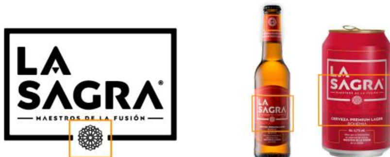
Figura 8. El arte mudéjar toledano en las etiquetas de La Sagra.

En relación con los mensajes y lemas que traslada a su comunidad, La Sagra busca incentivar aquellos vinculados a la provincia de Toledo como territorio y que aparecen en su página web ( cervezasagra.com ) como: “Inspirada en Toledo, para todos los cerveceros” e “Inspiradas en Toledo, premiadas en todo el mundo”, en alusión a los premios que sus cervezas han recibido en varios concursos internacionales.