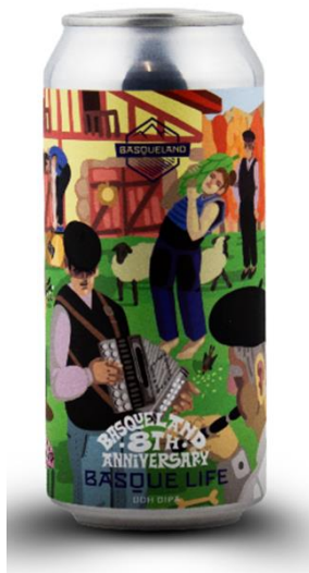
Figura 4. Empaque de Basque Life de Basqueland Brewing Project.

En 2017, la empresa lanzó una campaña que mostraba imágenes de paisajes vascos acompañados del lema: “Basqueland, la cerveza de nuestra tierra”, mostrando así su fiel compromiso con el País Vasco. La empresa, asimismo, ha apostado por diferentes estrategias de marketing para promocionarse, como la organización de visitas guiadas a su fábrica de Ordizia. Además, cada año la compañía inicia una fiesta de aniversario en la que invita a otras empresas cerveceras internacionales. En 2023 celebró su octava edición y la amplió a un tour por diferentes ciudades españolas. Igualmente, suele acudir a otros eventos de Euskadi como el Basque Culinary World Prize y la San Sebastián Gastronomika. Por último, cuenta con merchandising propio.