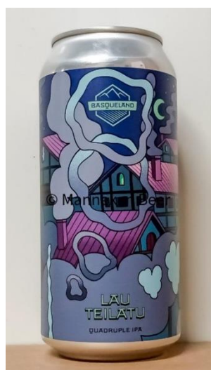
Figura 3. Empaque Lau Teilatu Basqueland de Brewing Project.

En la figura 3 vemos cómo la lata de Lau Teilatu muestra un gran caserío vasco en tonos oscuros: