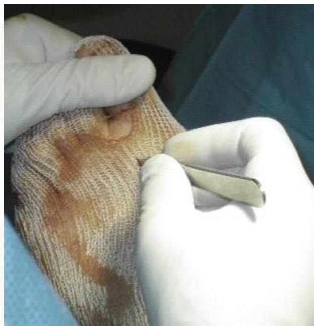
Fig. 1 Liberação percutânea do tendão da adutora.

teriormente, a cabeça metatarsal pode ser deslocada mais de 75% do diâmetro do primeiro metatarso, se necessário, permitindo correções de AIM graves. É uma osteotomia completa, e deve ser estabilizada com fio K intramedular. Controle a posição com fluoroscópio em vistas laterais e anteroposteriores.