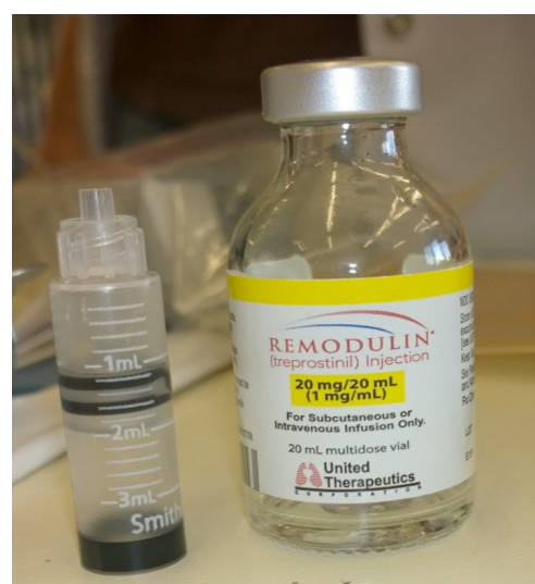
Figura 2. Recipiente para cargar la ampolla