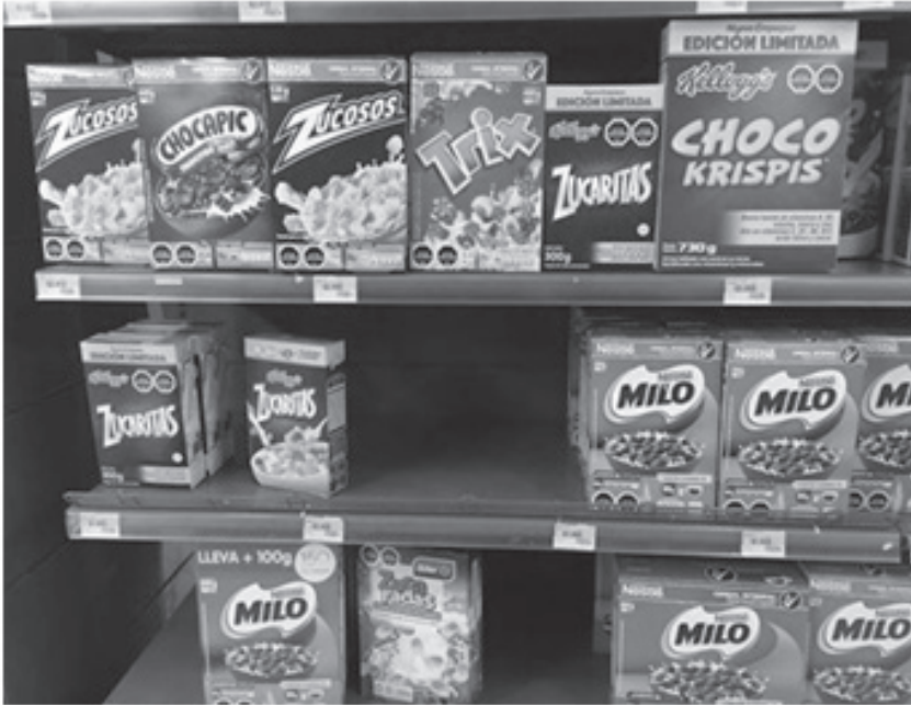
Estantería en un supermercado chileno. 25

Estos interrogantes tampoco han sido resueltos de manera pacífica internacionalmente. Distintos comités de la Asociación Interamericana de Propiedad Intelectual (ASIPI), por ejemplo, han criticado fuertemente las medidas adoptadas por el Estado mexicano, pues consideran que, al eliminarse el uso de caricaturas y dibujos de los empaques de los productos alimenticios para consumo humano, se están imponiendo limitaciones excesivas sobre el uso de la marca, cuando aún no se han comprobado beneficios directos para los consumidores (Asociación Interamericana de Propiedad Intelectual, 2019).